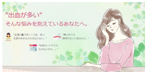
“出血が多い” そんな悩みを抱えているあなたへ。